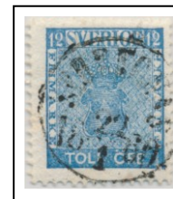
1018C013 lev 9-11