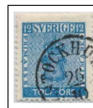
1018E063a lev 14-19

lev 12-13 (12C) inrikes brev 1:a vk (max 1,25 lod 1.7.1858 - 31.12.1862)