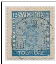
1018B063 lev 6-8 (6)