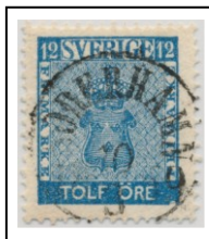
1018A018 lev 1-5

Stadium A pos 18 Stadium B pos 63 Stadium C pos 13 Stadium D pos 18 Stadium E pos 63