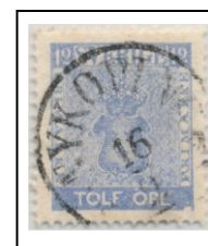
1018E063b lev 20-26