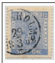
4083B083 lev 28-32

Position 38 i plåt 3 har ett skruvavskav på övre högra hörnet som saknas i plåt 4