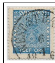
4083C083b lev 35-45