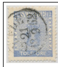
3083B083 lev 28-32