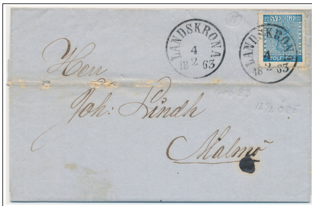
4083C083b lev 35-45

inrikes brev 1:a vk (max 4 ort = 17 gram 1.1.1863 - 31.12.1884)