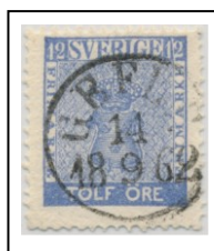
4083C083a lev 33-34